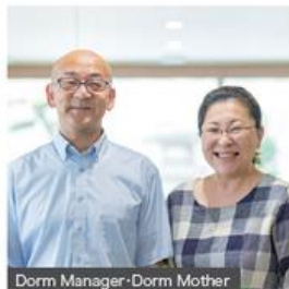
Dorm Manager・Dorm Mother