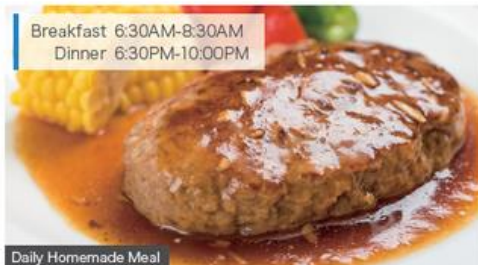
Breakfast 6:30AM-8:30AM Dinner 6:30PM-10:00PM

※Except designated holidays such as Sundays, public holidays, summer and winter holiday.