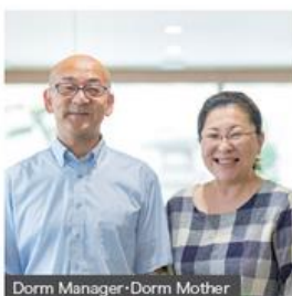
Dorm Manager-Dorm Mother