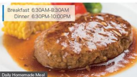
Daily Homemade Meal

※Except designated holidays such as Sundays, public holidays, summer and winter holiday.